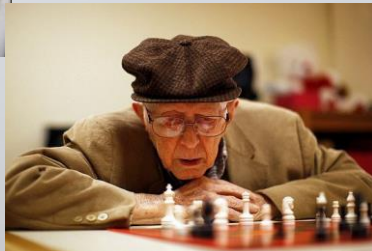
Cette photo par Auteur inconnu est soumise à la licence CC BY-SA