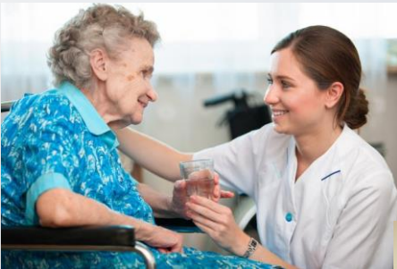
Cette photo par Auteur inconnu est soumise à la licence CC BY